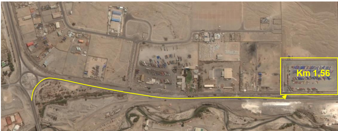
Figura N°1: Ubicación Recinto Antepuerto.

Los requerimientos y especificaciones técnicas mínimas que debe considerar el Contratista para la exitosa ejecución de los trabajos se detallan en los presentes Términos de Referencia.