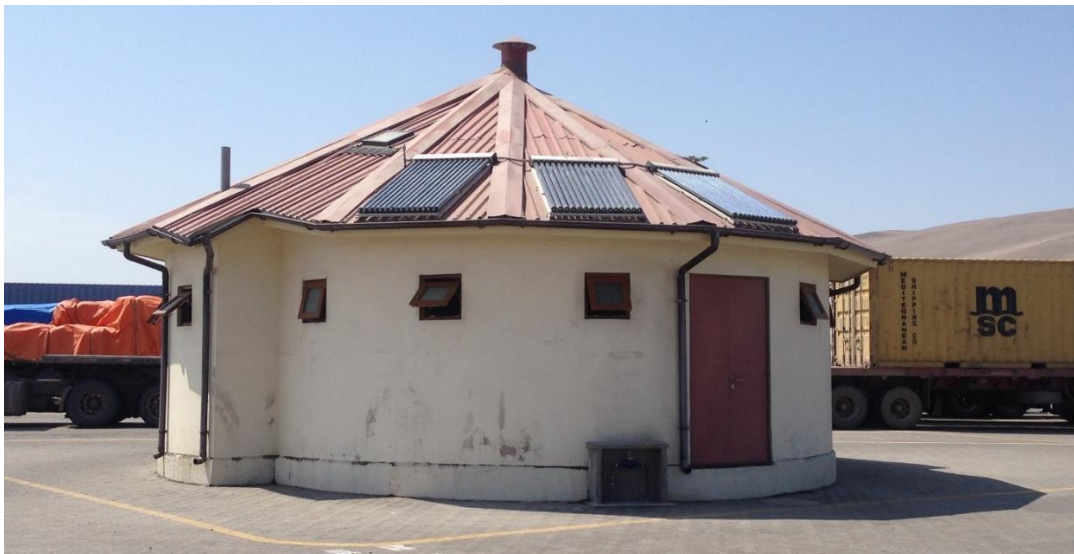
Imagen 2: Batería de baños.

Para realizar la restauración y conservación de las oficinas y baños de Antepuerto, el Contratista deberá seguir a cabalidad las indicaciones y descripción de los procedimientos de los trabajos que se detallan a continuación: